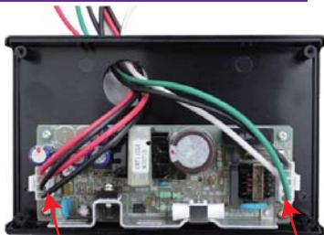
12V 出力 × 2